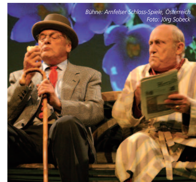
Bühne: Arnfelser Schloss-Spiele, Österreich