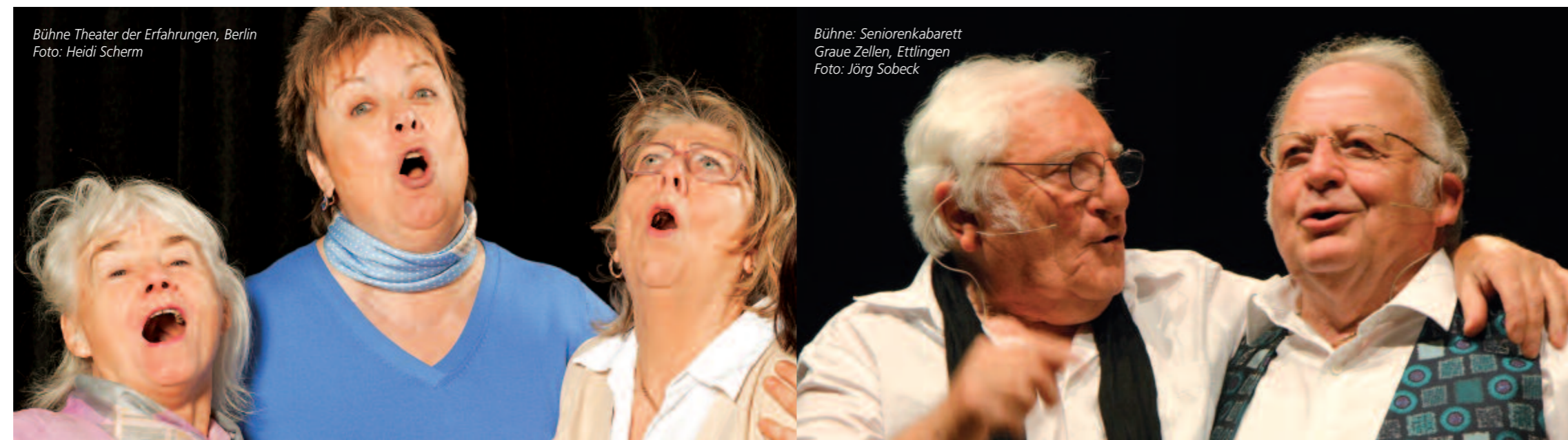
Bühne Theater der Erfahrungen, Berlin