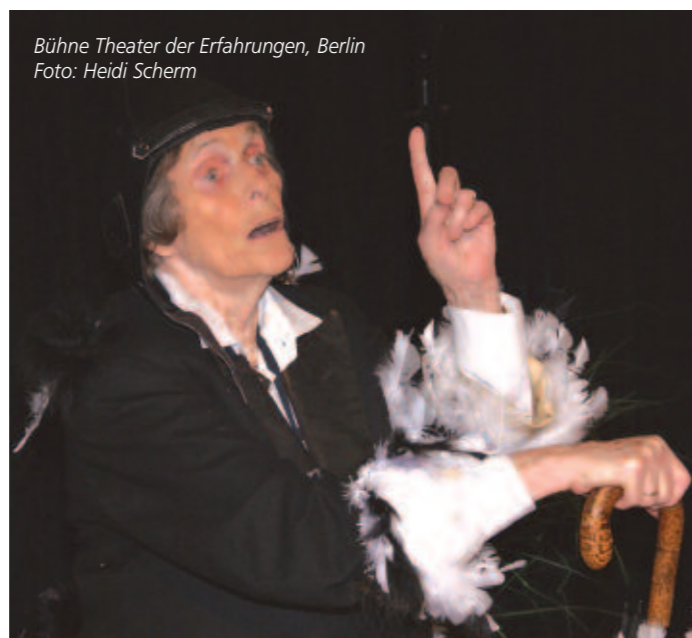
Bühne Theater der Erfahrungen, Berlin

Es gibt zahlreiche Formen, Musik und Theater auf der Bühne zu verbinden – vom Ballett über Musiktheater bis hin zu Schauspielmusik. In diesem Workshop wollen wir Funktionen von Schauspielmusik untersuchen und vor allen Dingen selber erproben, mit welchen Mitteln welche Effekte erreicht werden können. Beispielfähig wollen wir auch Textmaterial benutzen, das es uns ermöglicht herauszufinden, ob es uns gelingt, über die Effekte, die Form hi-