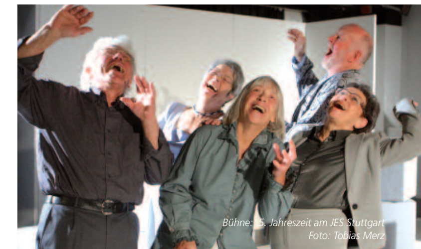
Bühne: 5. Jahreszeit am JES Stuttgart

Bundesweite Multiplikatorenfortbildung für Senioren und Fachkräfte Scheinfeld (Bayern) 31.10. - 4.11.2010 Berlin 10. - 14.01.2011